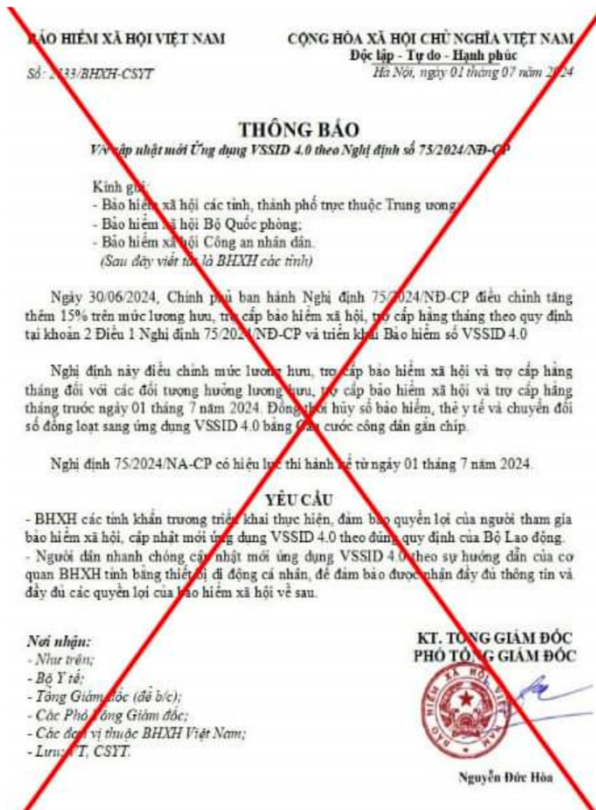
Văn bản giả mạo văn bản của BHXH Việt Nam